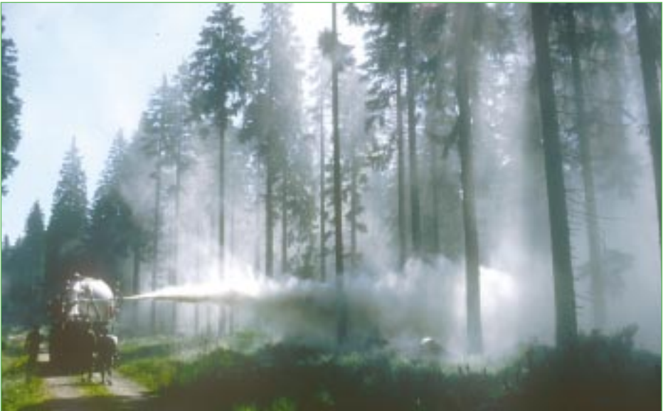
Abbildung 8: Kalkausbringung durch Verblasung