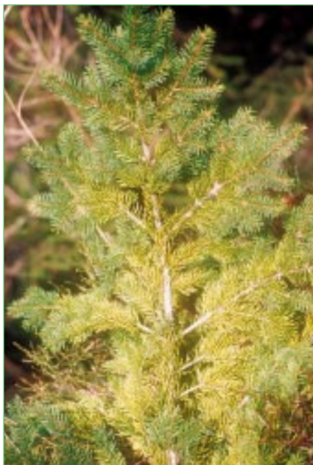
Abbildung 3: Magnesiummangel an Fichte