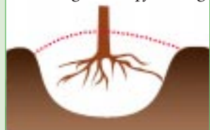
Abbildung 7: Lochpflanzung

Für die Laubbaumarten (vor allem Bergahorn und Esche) ist für ein entsprechendes Wachstum eine relativ hohe Basensättigung (> 30 %) erforderlich. Die übliche oberflächliche Ausbringung von Düngemitteln wirkt sich erst nach mehreren Jahren auf tiefere Bodenschichten aus. Daher ist meist eine Pflanzlochdüngung erforderlich. Bei der Pflanzlochdüngung soll eine Handvoll kohlenaurer Magnesiakalk eingebracht und gut mit dem Bodenmaterial vermischt werden.