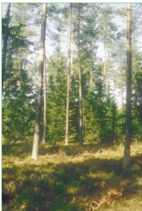
Abbildung 1: Föhrenwald mit Besenheide (Dobrowa, Kärnten)