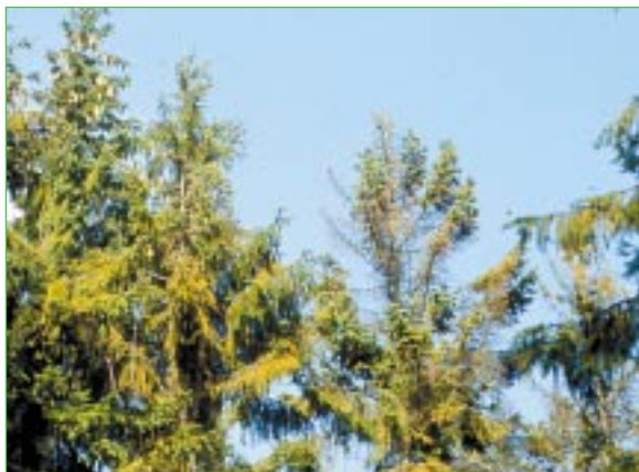
Abbildung 4: Neuartige Waldschäden im Böhmerwald: Nadelvergilbung infolge Magnesiummangel, Triebsterben durch Pilzbefall

Auftreten von unterschiedlichen Schadursachen erschwert eine eindeutige Zuordnung.